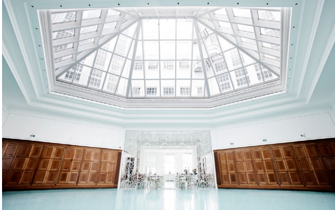
Ovenlys i brandprofiler ATP