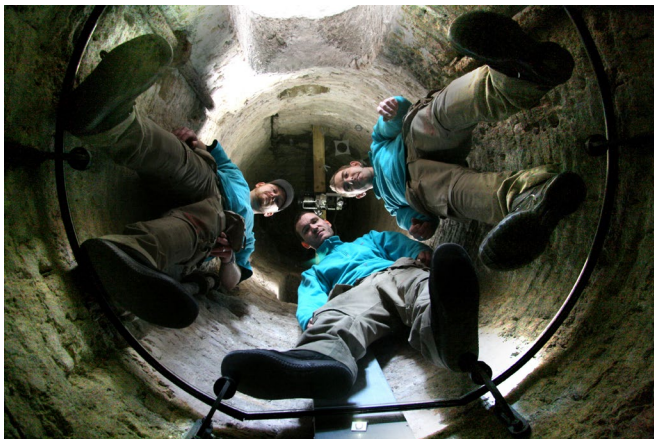
Rundetårn: Gå på glas i kernen monteret i 26 meters højde