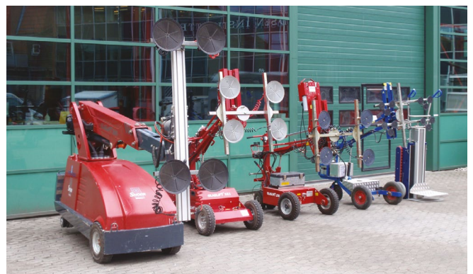
Løftegrej: Glaslift 500, Glaslift 351, Glaslift 250, Winlet 200, trappekravler