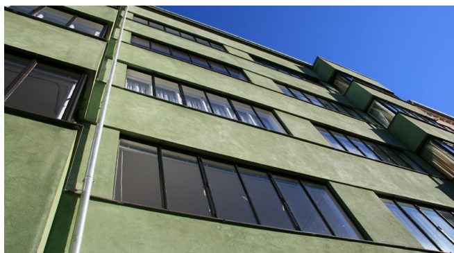
Det grønne funkishus: Kitning af store false med specialkit