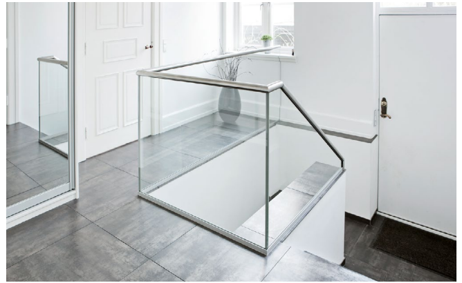
Privat villa: Glasværn