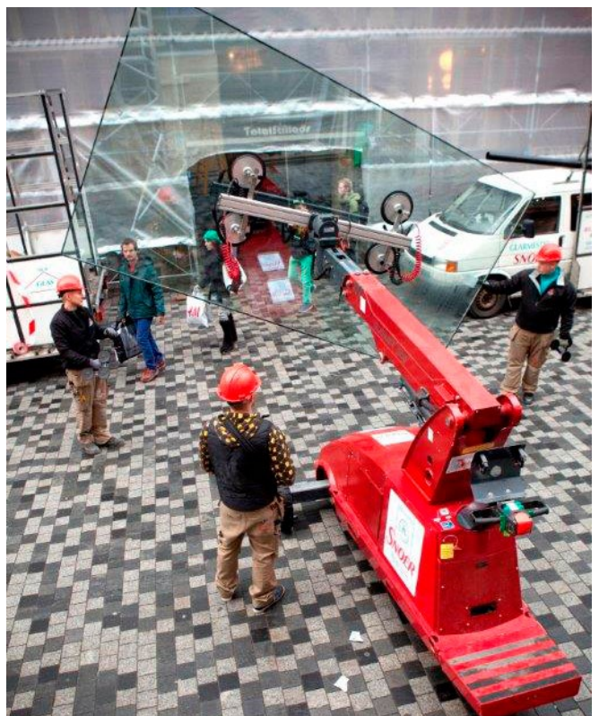
Montering af store ruder med Glaslift 500