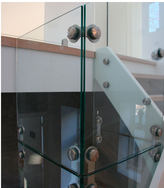
Privat villa Østerbro: Værn med egne beslag, detalje